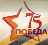
ГАРО. Ф. Р-3656. Оп. 1. Д. 20. Л. 22, 24